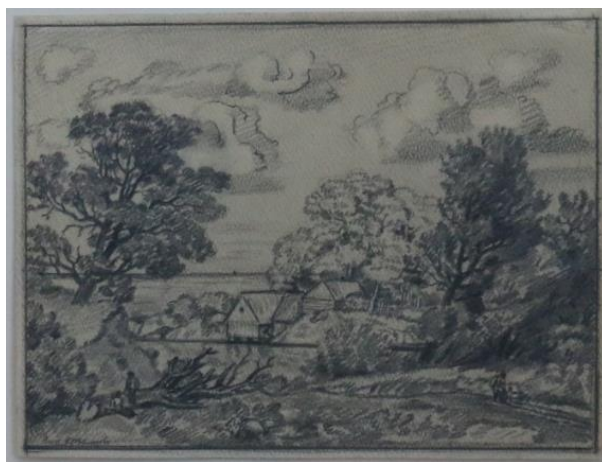
Н.П. Крымов. Эскиз к картине "Мельница". 1920-е г.

Там Н.П. Крымов возродил традиции тональной реалистической пейзажной живописи и сформулировал свою ясную последовательную теорию верности тона, которая легла в основу его педагогического метода. Позже Николай Петрович будет вспоминать те самые дни, проведенные в Звенигороде, когда он полный творческих сил, еще не сраженный недугом бродил со своим этюдником по окрестностям старинного русского городка, много и увлеченно работал, занимался любимой рыбалкой. Здесь еще больше художник постиг покоряющую силу и правду левитановских пейзажей. Звенигород стал важным этапом в развитии тональной живописи мастера. В фондовой коллекции Плесского музея-заповедника имеется графическая работа Н.П. Крымова, созданная в это время.