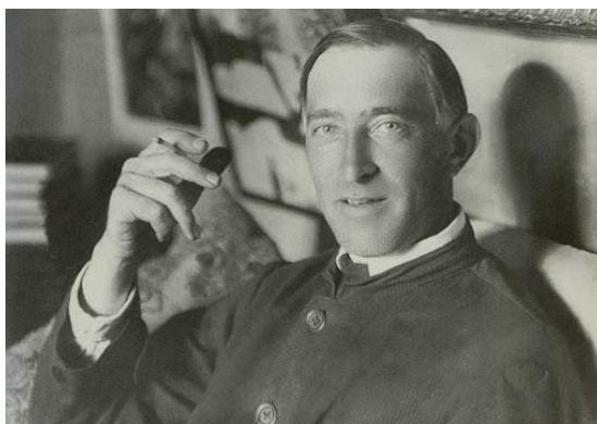
Николай Крымов, 1921 год.