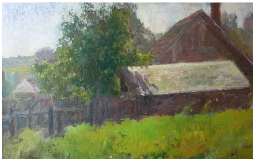
Н.П. Крымов «Таруса. Сарай» 1954 г.