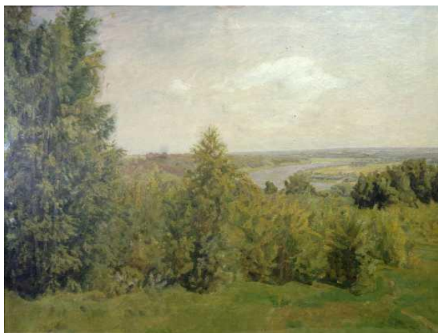
Н.П. Крымов «Вид на Оку». 1948 г.